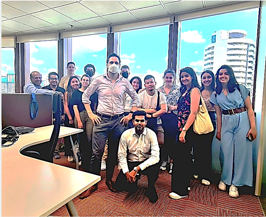
Visite des bureaux de l'AFP de Kuala Lumpur