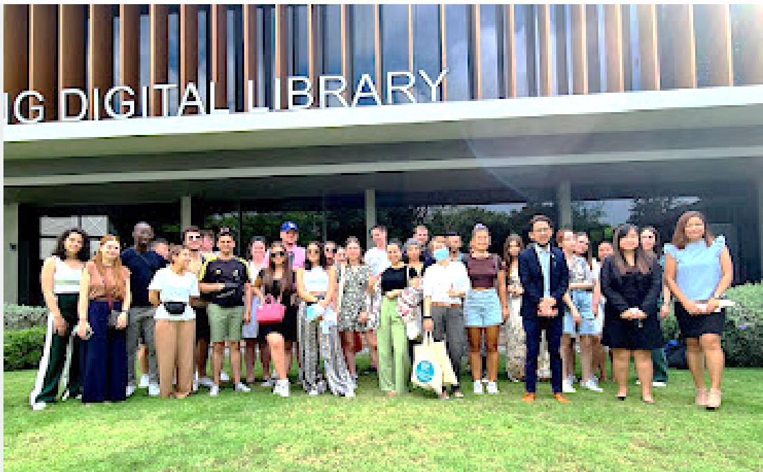
Visite de l'organisme public Invest Penang, de promotion des investissements & du développement économique de la région de Penang