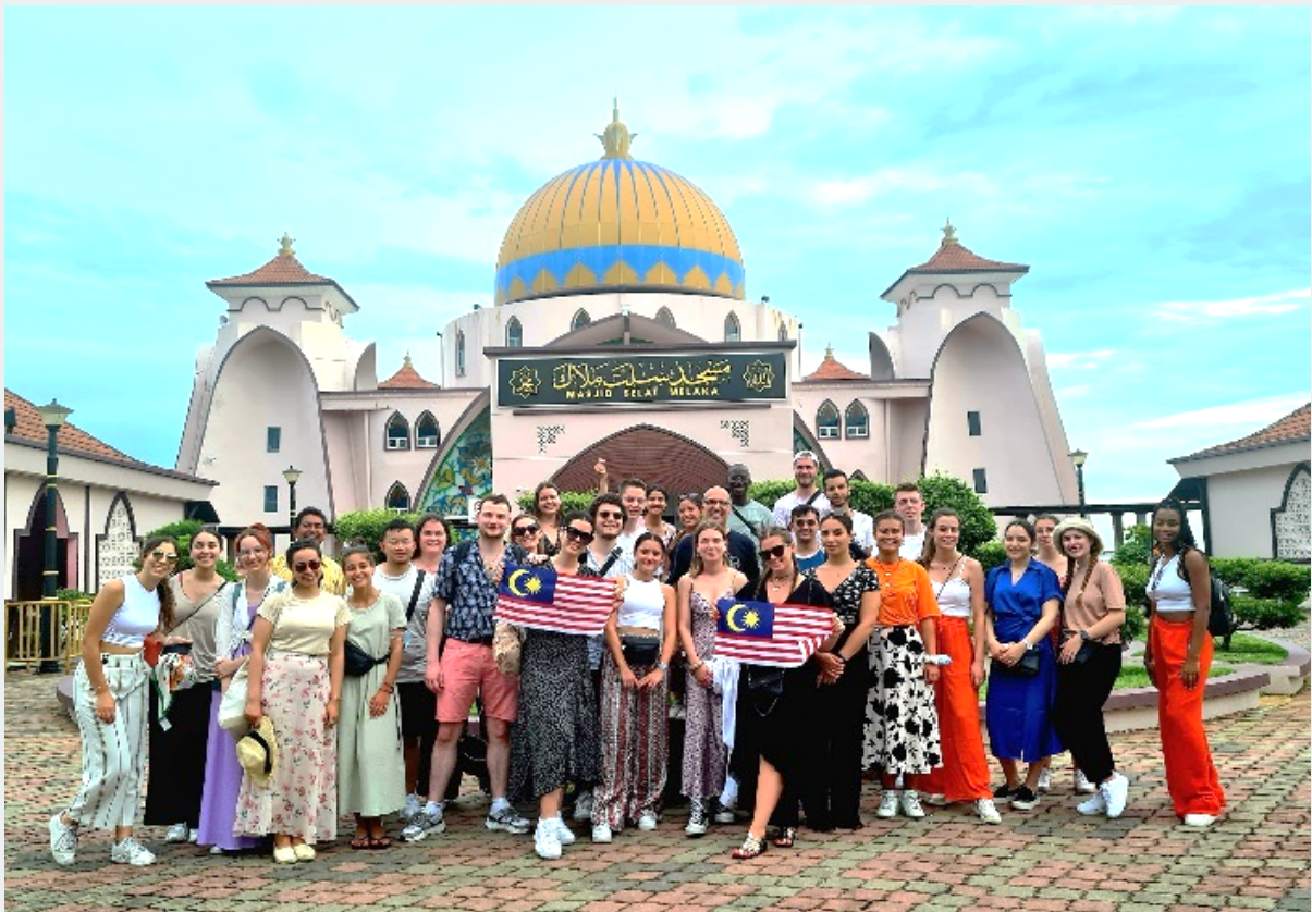
Visite de la ville de Malacca et rencontre avec la communauté Chetti