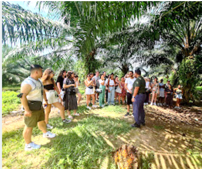
Visite de la plantation Sime Darby et découverte de la filière d'huile de palme et des enjeux économiques et environnementaux