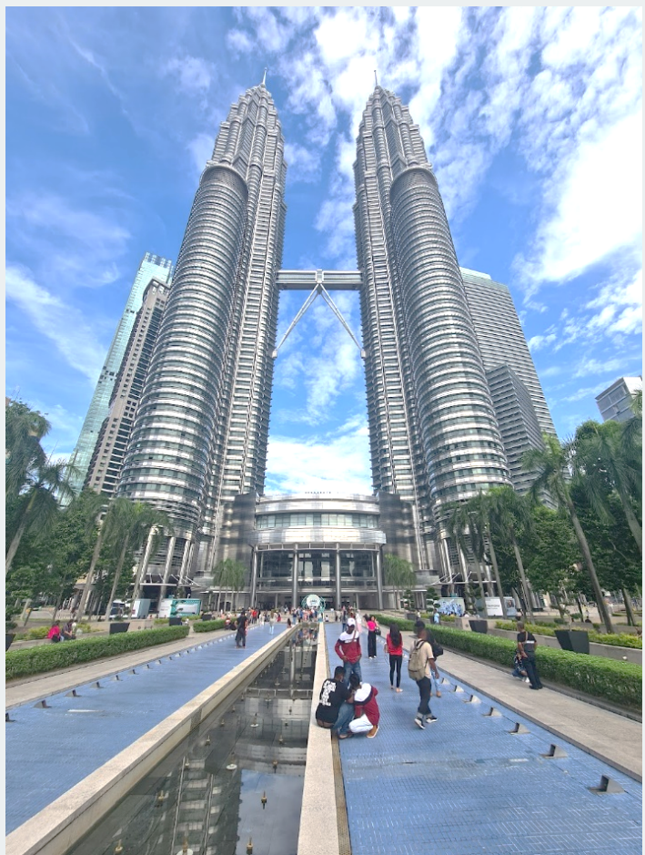
Les visites culturelles : Temples hindouistes des Batu Caves (Kuala Lumpur) - Temple bouddhiste Kek Lok Si à Penang – Tour jumelles Petronas (Kuala Lumpur)