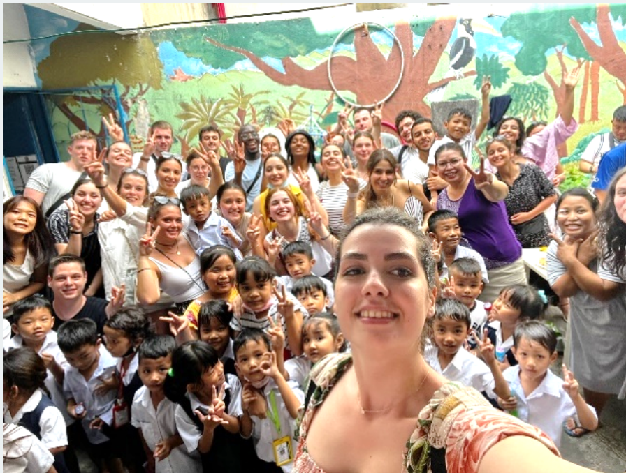
Visite de l'association Tanma d'aides aux femmes birmanes réfugiées en Malaisie (projet humanitaire du groupe projet Wanita)